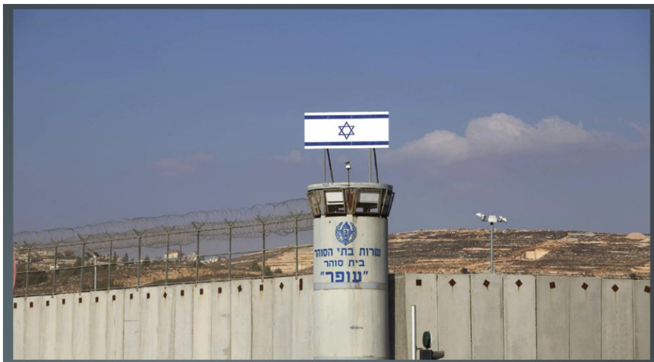
De Ofer-gevangenis.

G4S Technologies heeft een veiligheidssysteem verschaft voor de muren van de Ofer-instelling en er een centrale controlekamer geïnstalleerd van waaruit de gehele instelling kan worden gemonitord. Het Ofer-terrein omvat een gevangenis, een legerkamp en een militaire rechtbank. Deze Israëlische gevangenis is specifiek bestemd voor Palestijnse politieke gevangenen.