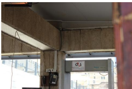
Checkpoint met G4S-bewaking in het Oude stadsgedeelte van Jeruzalem. Foto: Palestina Solidariteit, 11 mei 2014

Het nieuwe politiebureau vormt onderdeel van een “landzuiveringsschema” waarbij het de bedoeling is om een joodse enclave te bouwen in het hart van wat nu een Palestijnse buurt is in Oost-Jeruzalem, op de hellingen van de Olijfberg.