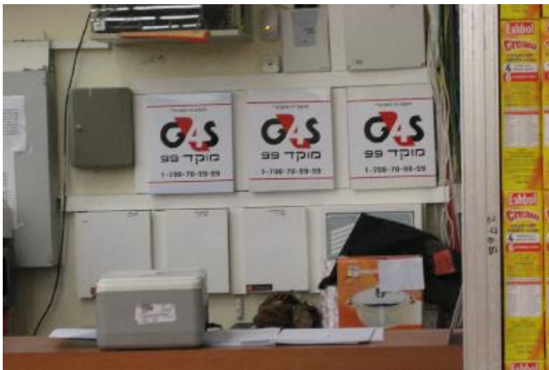
Apparatuur van G4S, geïnstalleerd in een supermarkt in de kolonie Modi'in Illit op de Westelijke Jordanoever

In juli 2010 verwierf G4S het privaat Israëlisch bewakingsbedrijf Aminut Moked Artzi dat verantwoordelijk is voor de bewaking van de Barkan industriële zone, verbonden met de illegale kolonie Ariel. Er zijn geen aanwijzingen voor de terugtrekking van G4S uit dit contract.